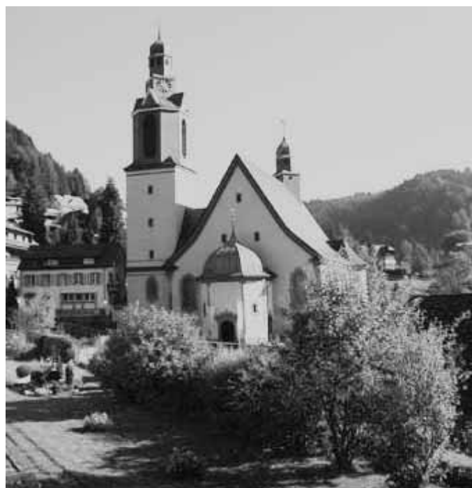
Die Wallfahrtskirche – das Ziel der Pilger