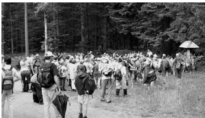
- Letzte Rast vor dem Abstieg nach Todtmoos -

Mit dem Monat Mai beginnt die Zeit, in der fast täglich Wallfahrtsgruppen zu Fuß oder mit Bussen zum Gnadenbild „Unserer Lieben Frau“ nach Todtmoos pilgern.